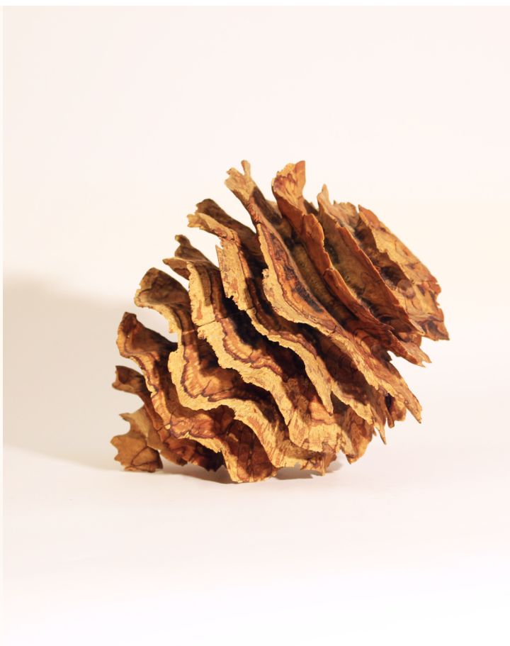
"Echauffé" Hêtre, tournage et sculpture 300mm