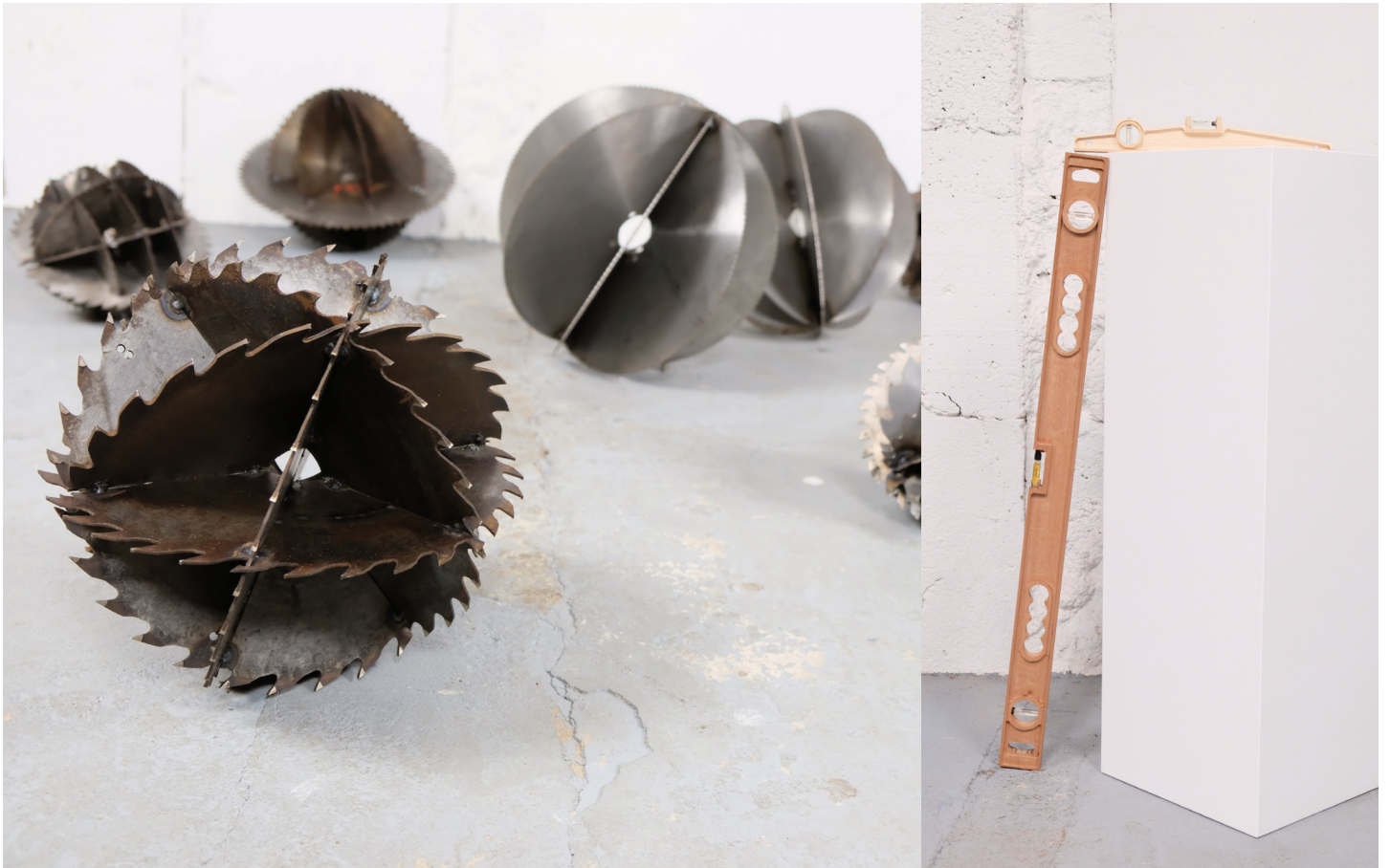
Constellation Circulaire. 2021 lames de scie assemblées 170x180x45cm