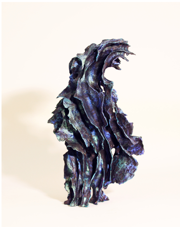
"Damnaa" Racine de buis sculpté. Finition acrylique 300mm