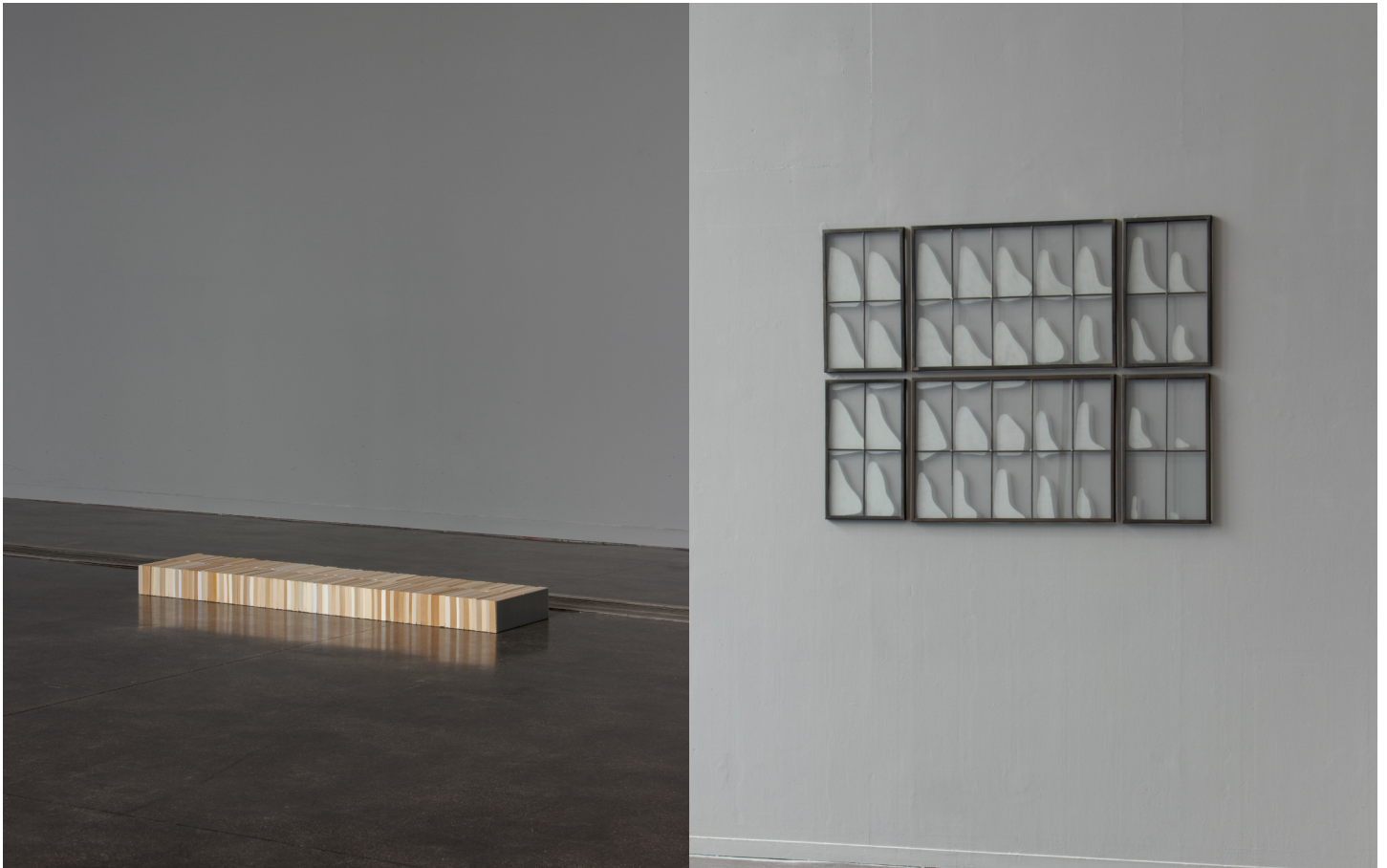
Ulisse, 2023, livres de poche, acier galvanisé, 150 x 35 x 10 cm.